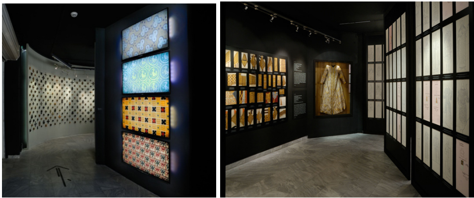
Slika 2: Fotografije s izložbe „Osvježavanje memorije“ u Muzeju primijenjene umjetnosti u Beogradu

Ornamenti iz perioda od XII. do XV. stoljeća osuvremenjeni su muzikom koja dopunjuje vizualni doživljaj. Originalnu muziku za izložbu komponirali su Goran Trajkovski, Dorijan Jovanović, Zoran Jerković i DJ Marko Nastić. Sve dvorane u kojima su bili izloženi eksponati bile su profesionalno ozvučene, a glazba pažljivo izabrana. Sama izložba nije raspolagala budžetom većim od uobičajenog koji Ministarstvo kulture dodjeljuje sličnim projektima, ali je potpomognuta značajnim sredstvima sponzora koji su bili privučeni prilikom da svoje ime povežu s događajem koji privlači pažnju i izaziva pozitivne asocijacije.