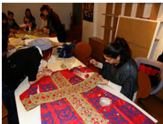
Slika 3: Učenici Dizajnerske i Tekstilne škole na radionici „Ornamenti kroz vrijeme i prostor“

Za učenike srednjih škola organizirane su radionice: „Ornament kroz vrijeme i prostor“ (cilj radionice je bio da se đaci upoznaju s pojmom ornamenta i njegovom upotrebom kroz različita povijesna razdoblja. Posebno su obrađivani ornamenti na odjeći, vladarskoj odori, nakitu, obući i drvenim rezbarijama, a tako nastali radovi izloženi su na izložbi u galeriji „Žad“) i „Ogledalske krivulje“ gdje se bavili kreiranjem bizantiskih i keltskih čvorova kao i mnogih drugih prepletenih ornamenta.